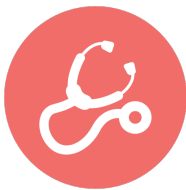
Les outils de la prévention