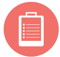
Formation à la prévention