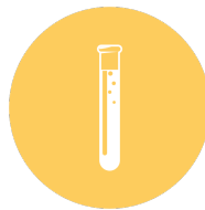
La gestion des déchets dangereux