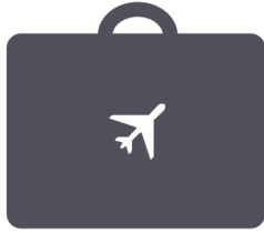
Association de personnels CASUP