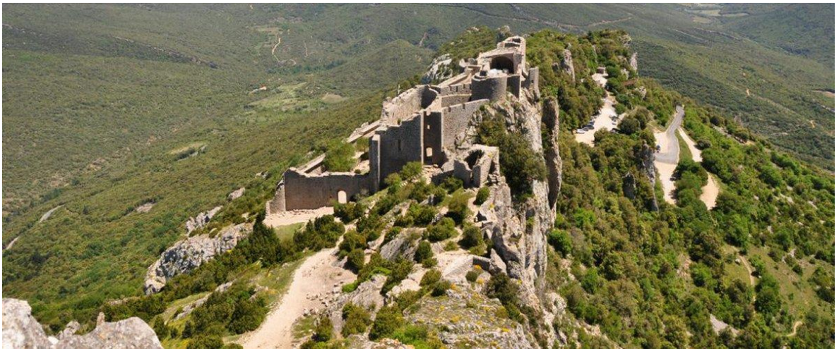
Château de Peyrepertuse / Castèl de Pèirapertusa

Pour les enluminures aller dans Mandragore http://mandragore.bnf.fr/html/accueil.html >