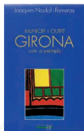
▶ Municipi i Ciutat, Girona com a exemple , 1988

Se qualifiant lui-même « d'historien de la cité », il a appliqué une méthode d'historien, regarder le passé pour comprendre le présent et préparer le futur , à toutes les fonctions et charges politiques qu'il a occupées.