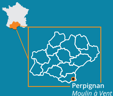
Perpignan Moulin à Vent