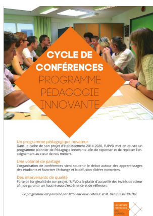
Programme des Conférences et des activités 2017-2018