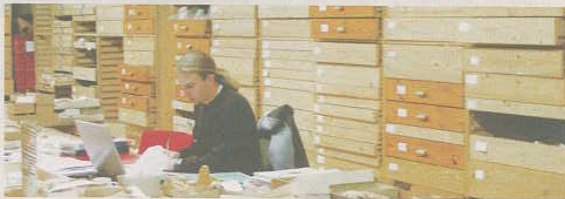
L'EPCC pourrait voir le jour avec le soutien de l'Agglo de Perpignan